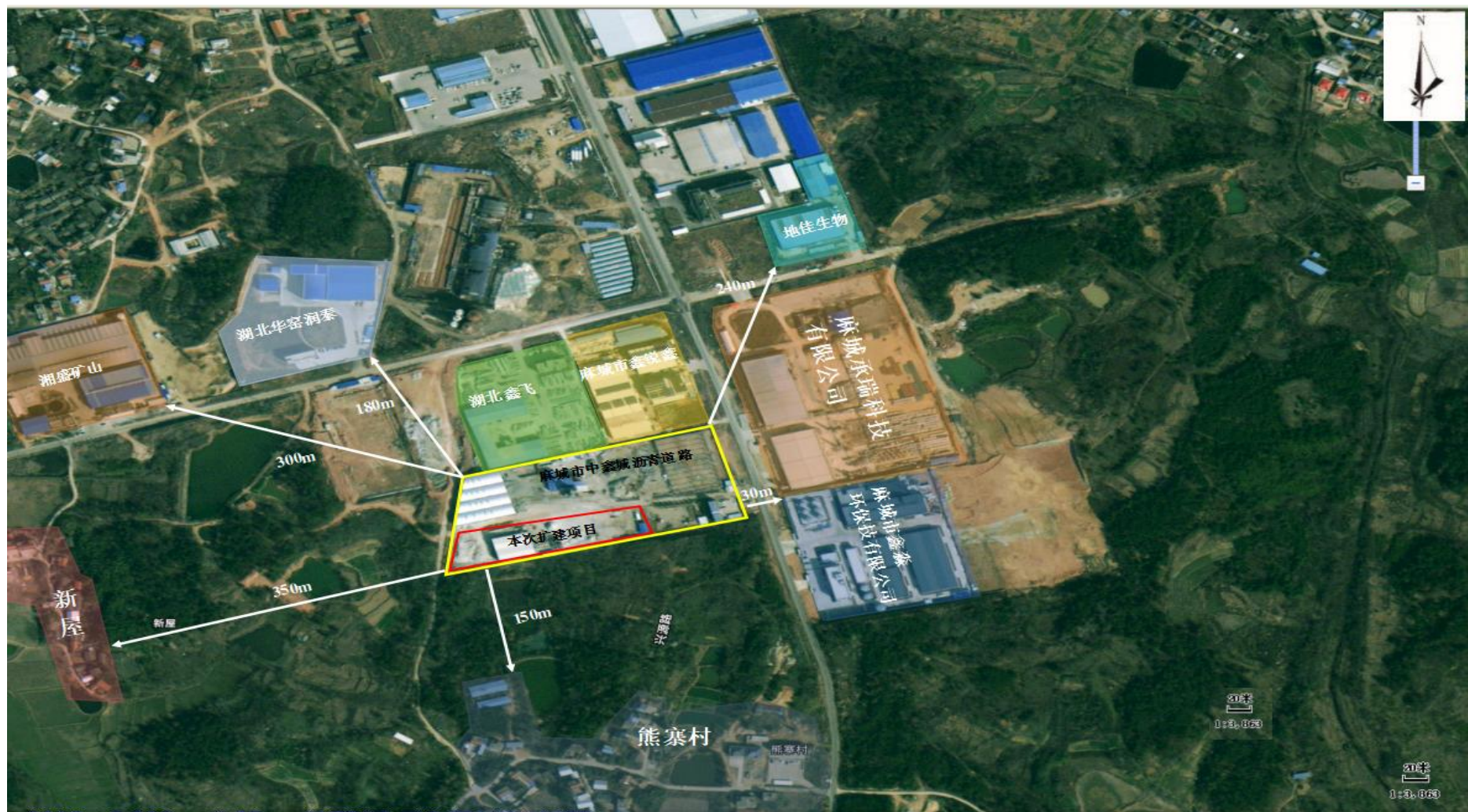
附图2 项目周边环境关系示意图