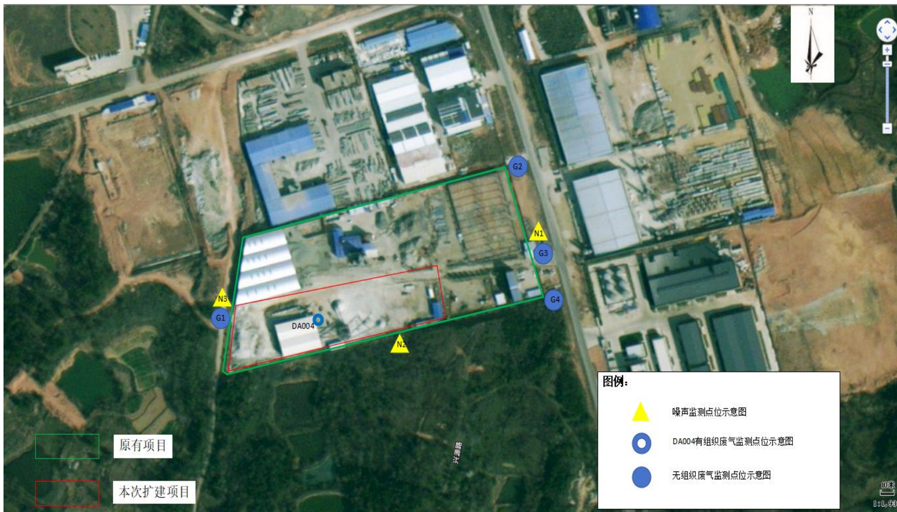
附图 4 项目验收监测点位示意图