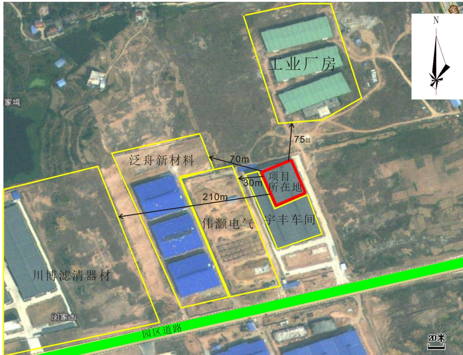
附图 2 项目周边环境关系图