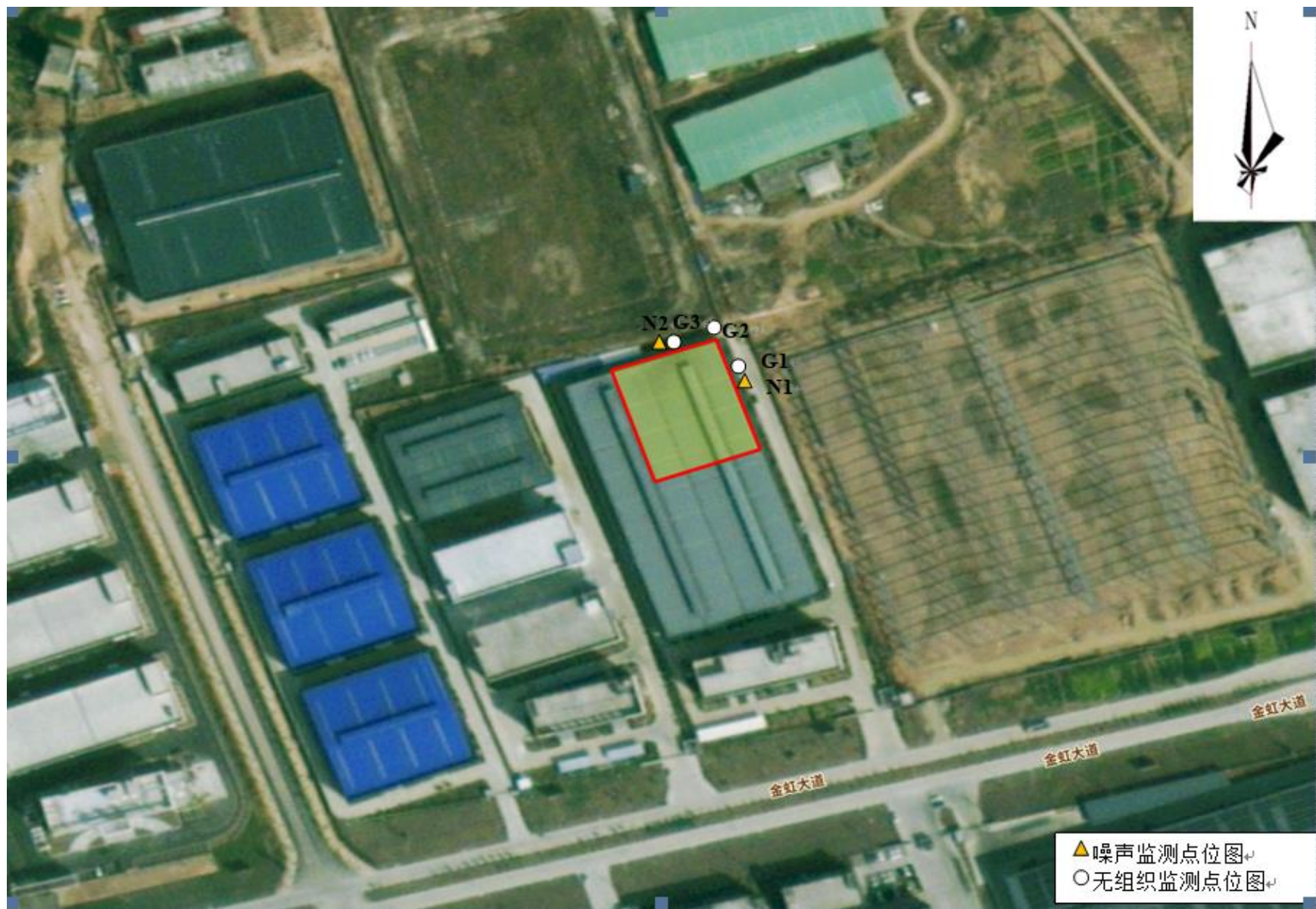
附图4 项目监测点位图